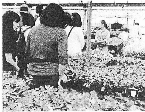
研修会（花苗生産農家での剪定研修）